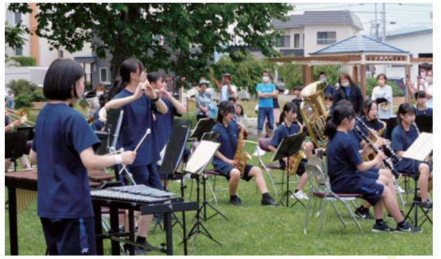
7月2日の南町内会の運動会(舞鶴公園)で参加者に演奏を披露