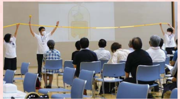
ヤクルトさん「健腸長寿」

主催：菊の里まちづくりネットワーク協議会 菊の里地区福祉のまち推進センター 菊水元町地区センター 共催：白石区第2地域包括支援センター 白石区介護予防センター菊の里 協力：白石区保健福祉部 白石区社会福祉協議会