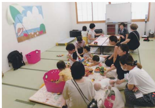
8月25日 クーラーの有る和室で初めて

『わくわくポケット』は2023年19年目を迎えました。今まで子育てサロンを継続されてきた皆さんに敬意を表するとともに、今後とも子どもたちと保護者の皆さんのお力に少しでもなれる様に地域、各団体の皆さんとともに努めて参りたいと思います。