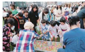
福まちは民生委員さんたちの協力を得て、スーパーボールを担当

夜半には雨が降り、日中も天気模様もスッキリせず実施判断も昼過ぎまで待っての状況でした。子どもたちの出足の心配もありながら開催でしたが、小学生以下650名程の参加で、例年より少ない参加でしたが盛大に開催することが出来ました。