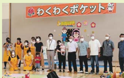
スタッフと写真を1枚お願いしました