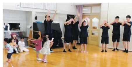
幼児の相手をする生徒さん