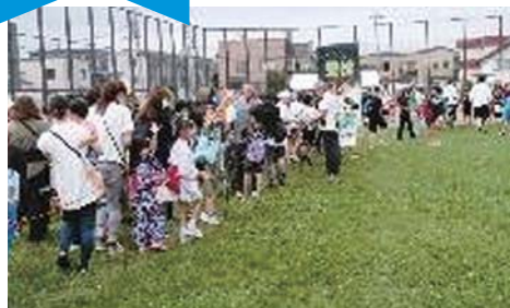
開催前の受付風景