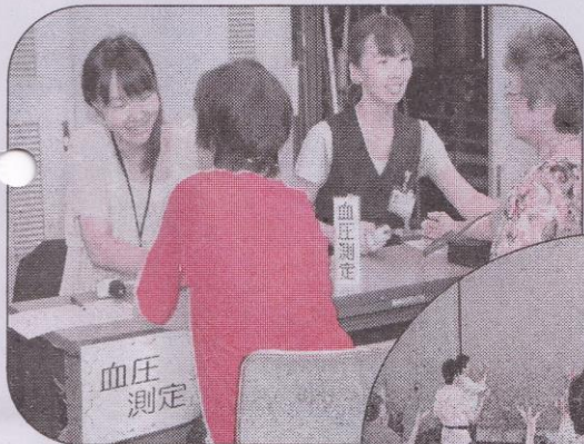
血圧だいじょうぶ?