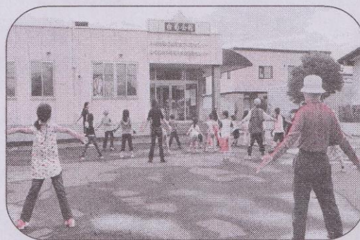
白菊会館駐車場にて