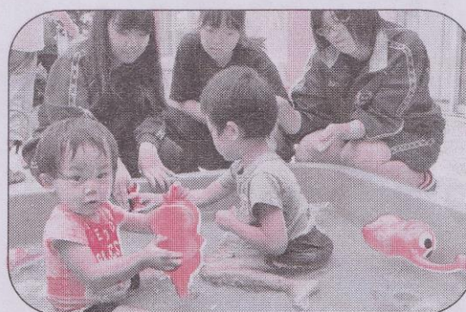
少し寒いけどお姉さん達と水遊び