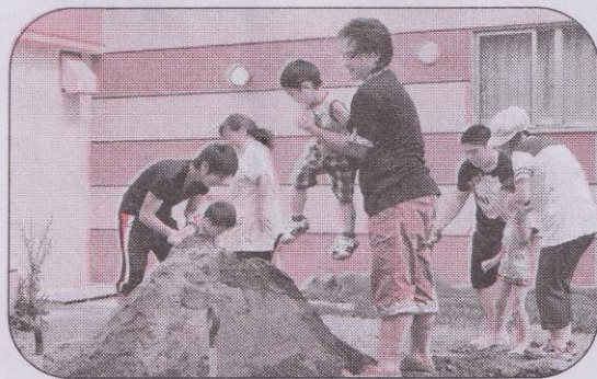
高い砂山に昇り大喜び

8月16日(金)きくすいもとまち幼稚園に於いて、白陵高校・米里中学校の学生ボランティアの協力を得て開催されました。園庭では、砂遊び・水遊びなどで楽しく遊んでいました。