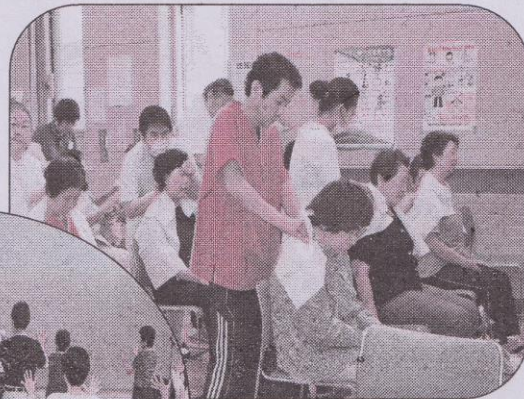
楽になったね ありがとう!