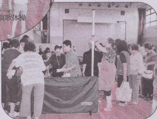
身長変わらなかったわ